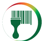
Digitalisation de la Supply Chain

Diagnostiquer mon besoin, choisir, acquérir et déployer mon système d'information logistique (WMS, TMS)