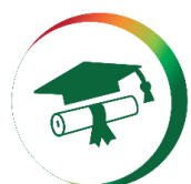
Certification des compétences

Certifier les compétences en Supply-Chain de mes employés